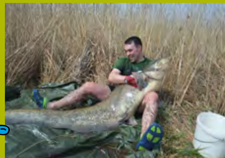
Druhý úlovek 210 cm odhadem 65 kg